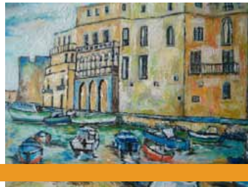
"Monopoli porto" - olio su MDF - 35x50cm

Accreditato per n. 15 medici specialisti in neurologia e neuropsichiatria infantile. I crediti ECM previsti sono n. 13. (Programma a pag. 44)