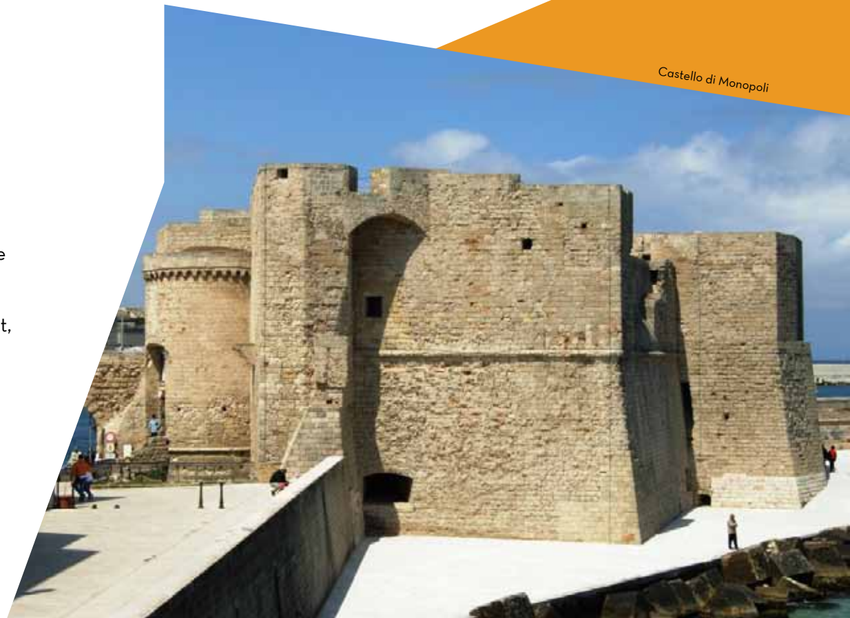
Castello di Monopoli

17.00-18.00 Assemblea elettiva AINAT. 2° convocazione