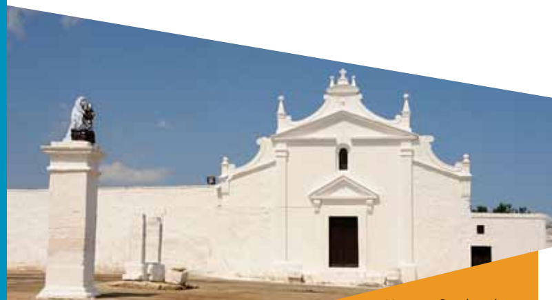
Masseria Conchia, chiesa