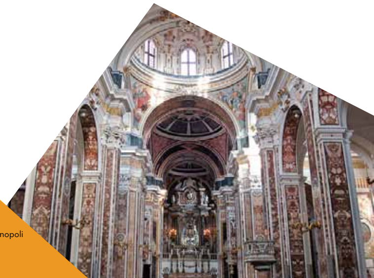
Cattedrale di Monopoli