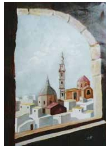
"Il campanile di Monopoli" olio su tela